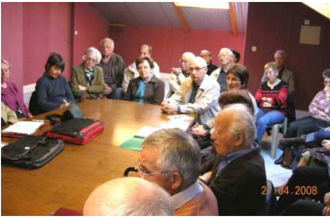
Un public attentif